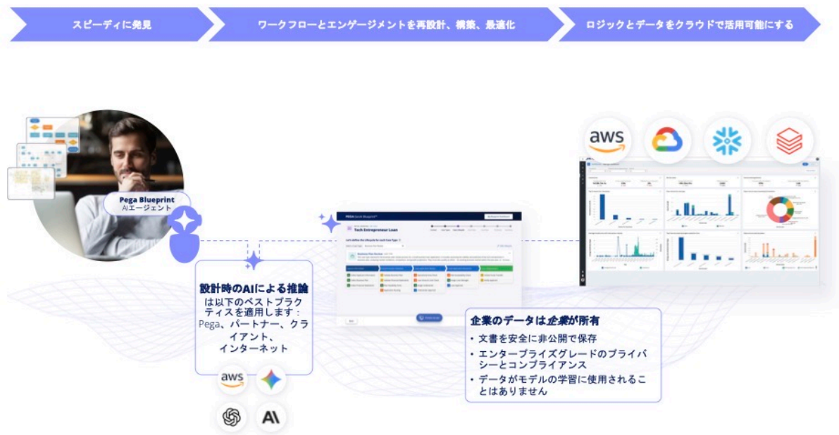
図1.Pega Blueprint : 最も重要な業務を再構築するAI