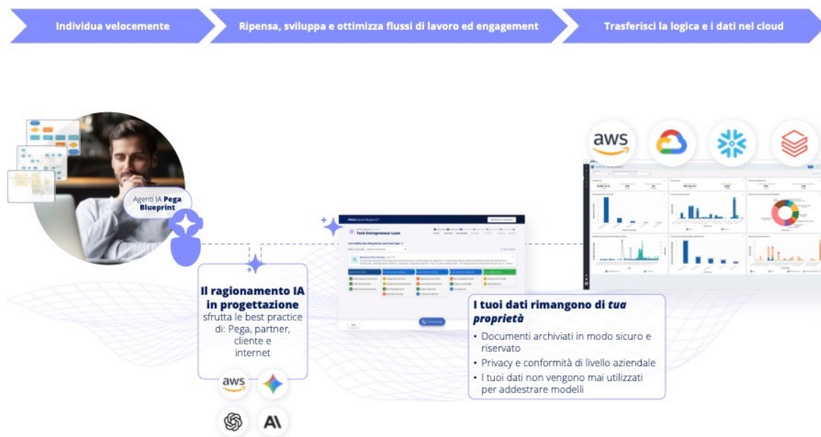
Figura 1. Pega Blueprint: un'intelligenza artificiale che rivoluziona il lavoro più critico

Pega Blueprint™ è il motore di reinvenzione che rende possibile tutto ciò.