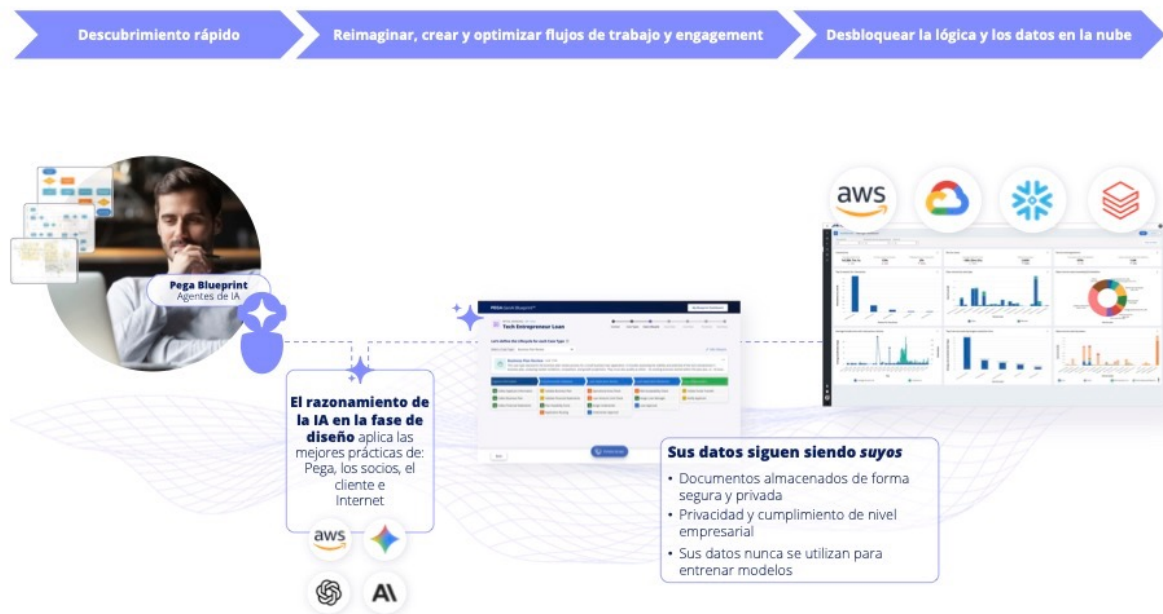
Figura 1. Pega Blueprint: IA que reinventa su trabajo más importante.

Pega Blueprint™ es el motor de reinención que lo hace posible.